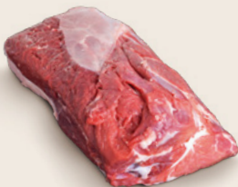
ALETTA DI SPALLA