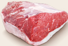
CAPPELLO DEL PRETE